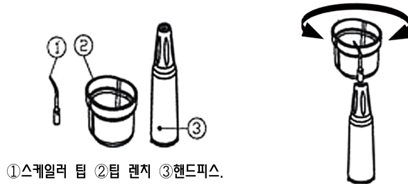
①스케일러 팁 ②팁 렌치 ③핸드피스.