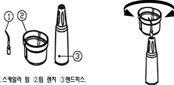
①스케일러 팁 ②팁 렌치 ③핸드피스.