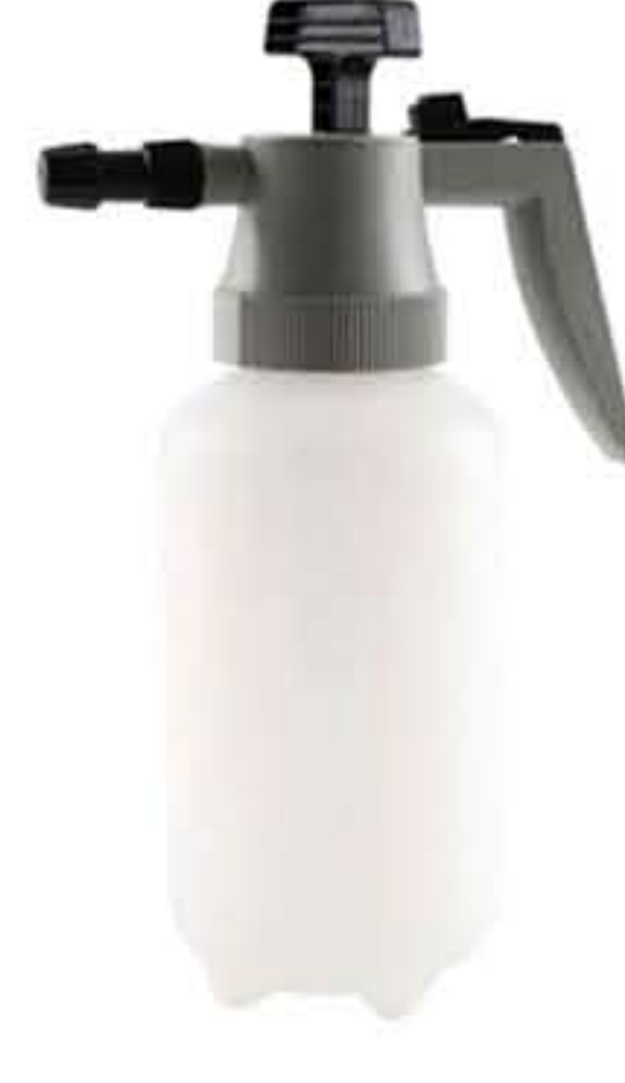
PUMP ( For Scaler Unit )