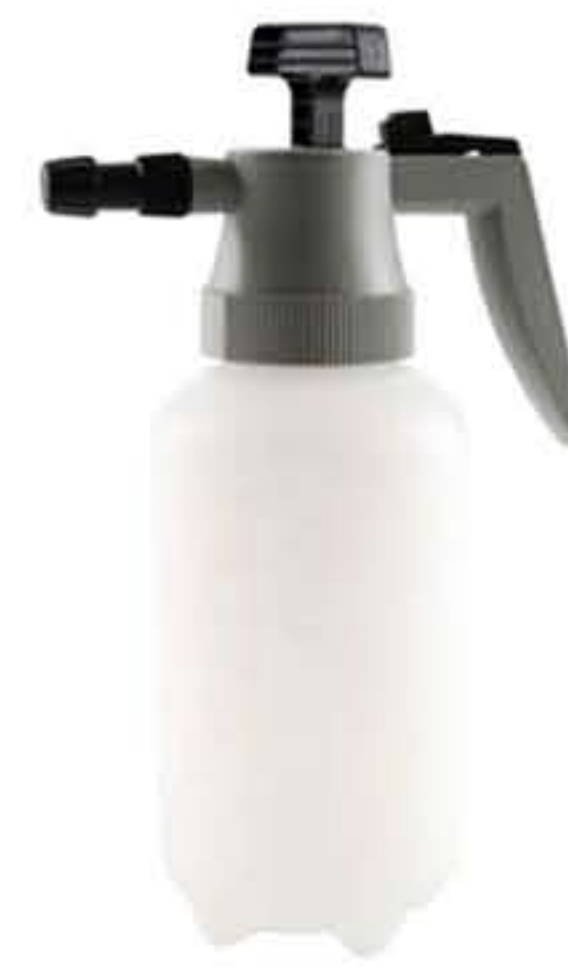
PUMP ( For Scaler Unit )