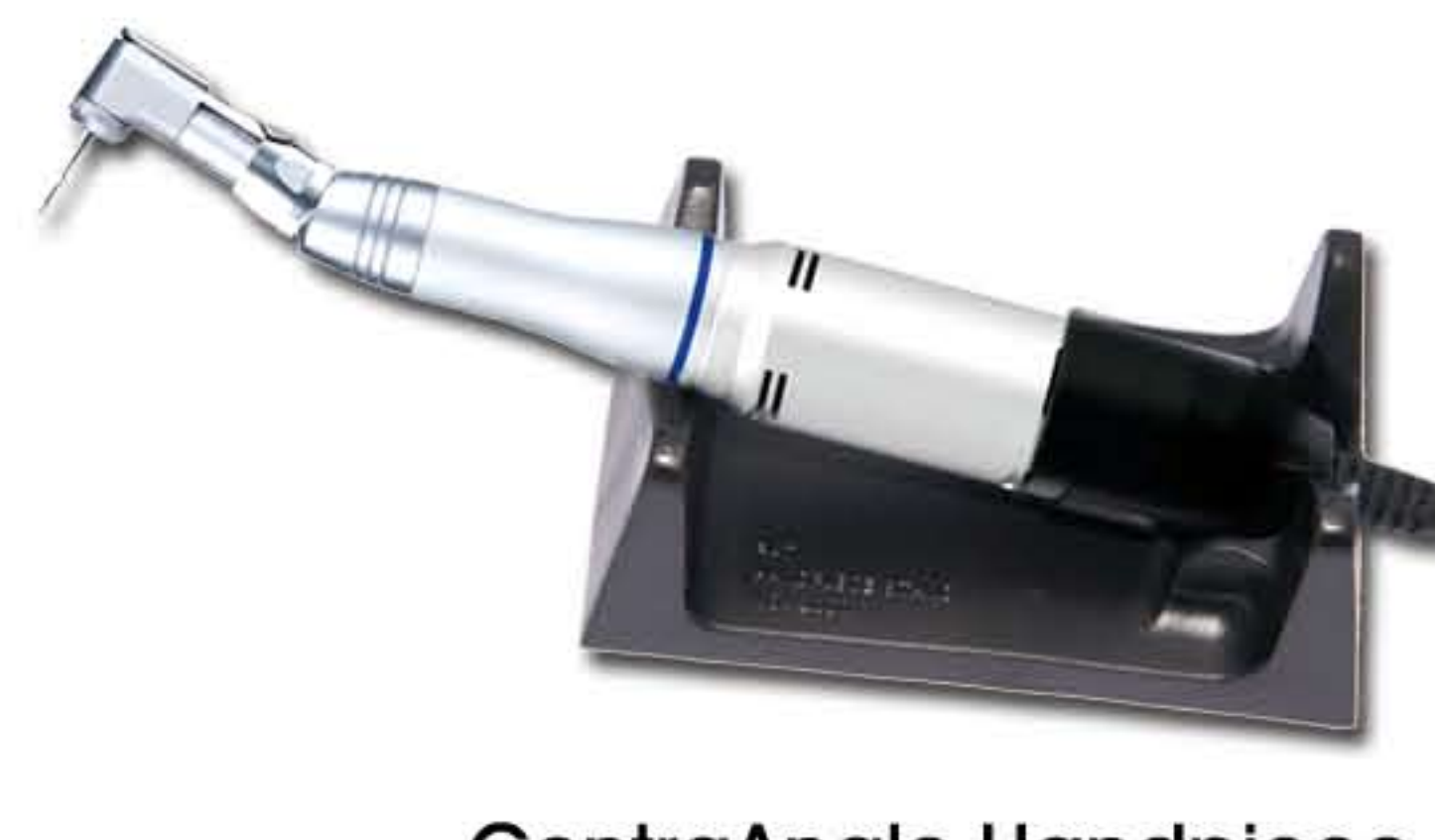
ContraAngle Handpiece + E-Motor